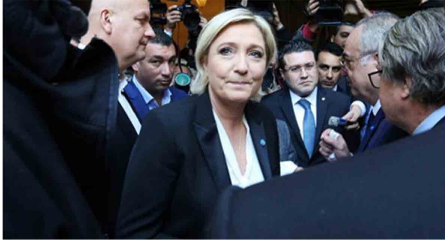
Францын саармагжсан баруун, хуваагдмал зүүн, хариуцлагагүй төвч хүчний урагшгүй байдал Үндэсний фронт намд хожоо болж байна.

Францын нийслэл Парис хот санхүүгийн үйлчилгээний компаниудыг Лондоноос татан ирүүлэхийг эрмэлзэж байна. > 10