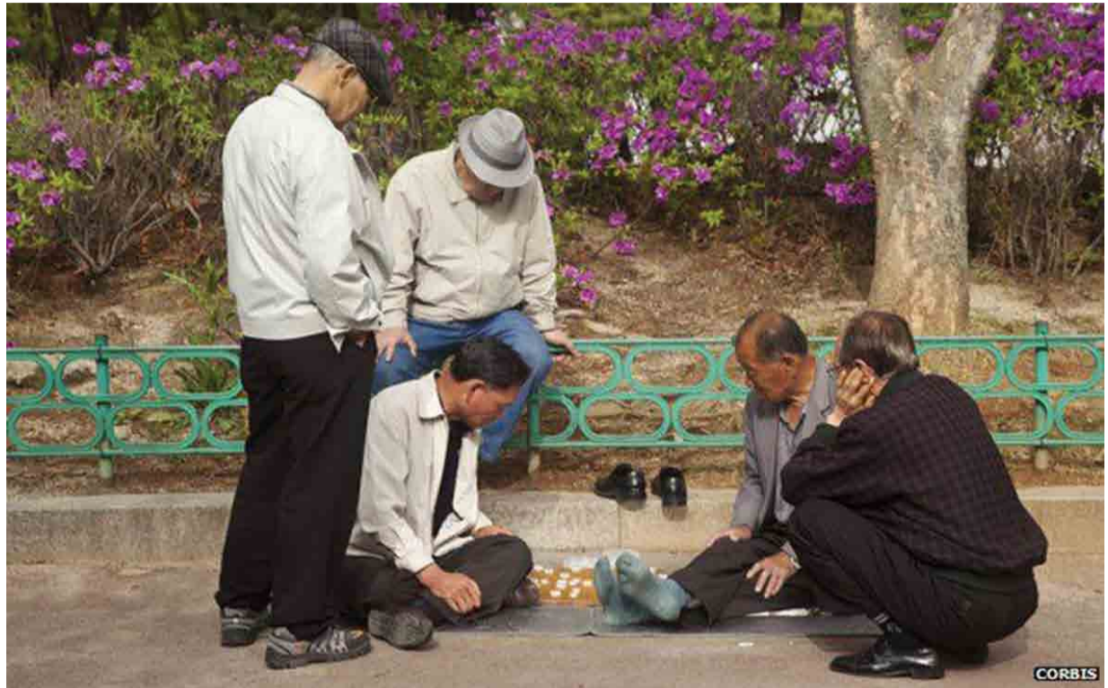
2030 онд эмэгтэйчүүдийн дундаж наслалт 90 насны босгыг давахын сацуу Азийн тэтгэврийнхний тоо Европынхоос олон болно.

Уг дүгнэлт тус улсын залуу үеийнхэнд илүү ачаалал ирэхийг харууллаа. Бусад судалгаанаас үзэхэд Азийн Хятад, Тайланд зэрэг улсад 2050 он гэхэд 65-аас дээш насныхны нийт хүн амд эзлэх хувь хэмжээ өрнөдийн орнуудаас давна гэсэн таамаг дэвшүүлжээ. Өнгөрсөн оны нэг