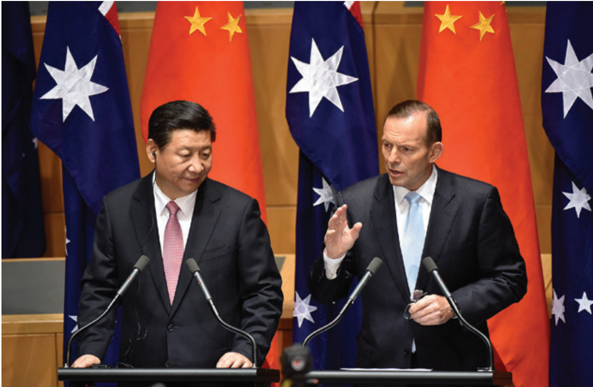
Канберра Вашингтоныг бүс нутаг дахь оролцоогоо нэмэгдүүлэхэд шахалт үзүүлэхийн зэрэгцээ Австрали руу чиглэсэн Хятадын хөрөнгө оруулалтын их урсгалд хатуу хяналт тавьж эхэлсэн.