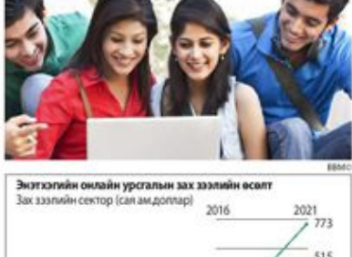
Энэтхөгийн онлайн урсгалын зах зээлийн өсөлт